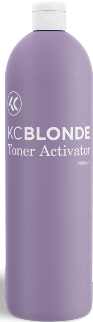
Kiszerezés: 1000 ml