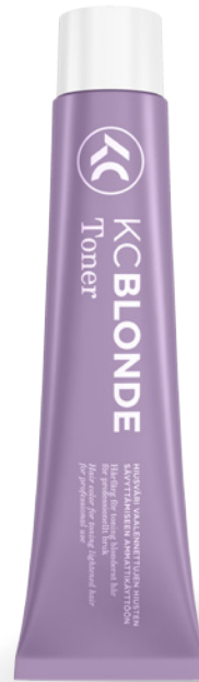
Kiszerezés: 60 ml

Újfajta pigmentszerkezetének köszönhetően a KC Blonde Toner színpigmentjei hatékonyabban kapcsolódnak az előzőleg világosított hajhoz. A pigmentszerkezet és a KC Shield technológia lehetővé teszi, hogy olyan kiváló minőségű színeredményt hozzunk létre, amely ragyogóan tükrözi a fényt, és árnyalata valóban hosszabb ideig fenntartható.